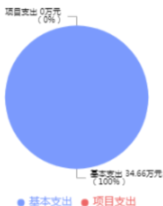
支出预算总体结构图

中国共产主义青年团新乡市红旗区委员会2026年支出合计34.66万元，其中：基本支出34.66万元，占100.00%；项目支出0万元，占0%。